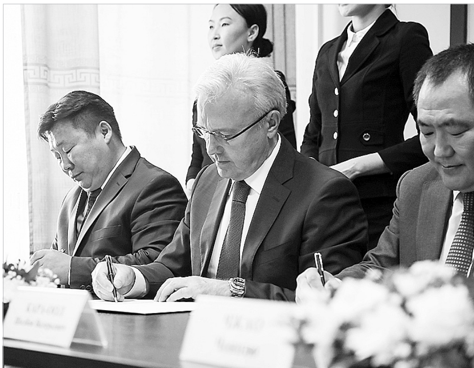
☑ Трансграничный коридор, соглашение о котором было подписано в Кызыле, позволит Красноярскому краю более свободно торговать с Монголией и Китаем

Для СФО с нашими сумасшедшими просторами вопросы транспортной инфраструктуры – безусловный приоритет. И в последнее время сибиряки все пристальнее смотрят в сторону Монголии и Китая. Так, в этом году в рамках проекта «Енисейская Сибирь» мы начинаем строительство железной дороги Курагино – Кызыл. В среднесрочных планах дорога рассматривается с продолжением в Монголию и Китай. Идет работа и над созданием автомобильного коридора между Россией и Монголией с открытием пограничного пункта Хандагайты – Боршоо для перемещения грузов и граждан из третьих стран. На стадии реализации и договоренности о запуске авиасообщения между Кызылом, Улан-Батором и Пекином. С китайской стороны желез-